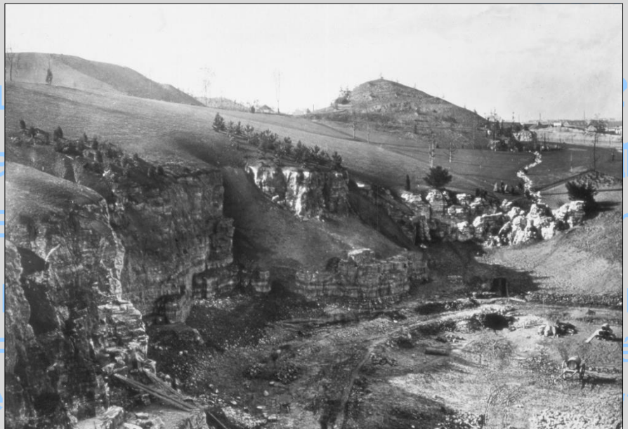
Les carrières de gypse des Buttes-Chaumont avant les aménagements